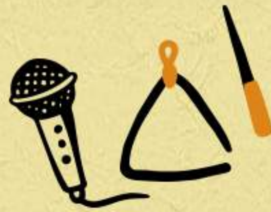
triângulo e voz