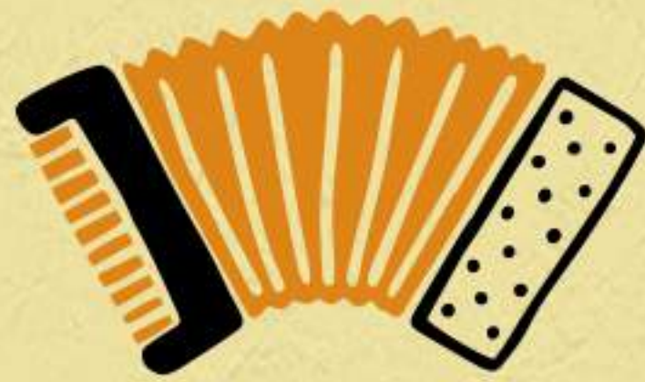
sanfona e voz