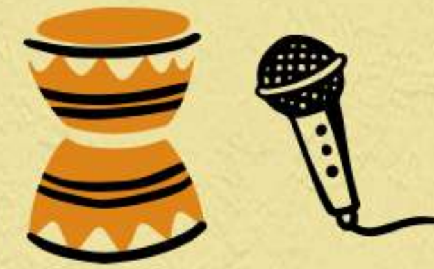
zabumba e voz